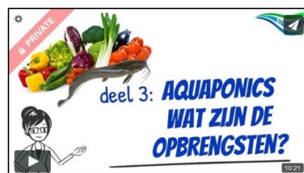
Drie animaties: voedselproblematiek, aquaponicskringloop en de opbrengsten van aquaponics €60,50 (incl. BTW)