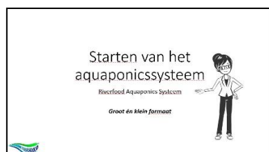
Instructies om een systeem te starten (digitaal) €30,25 (incl. BTW)