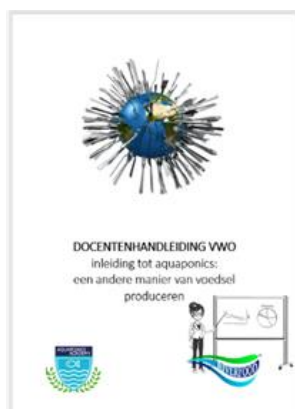
Docentenhandleiding (digitaal) €60,50 (incl. BTW)