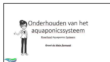
Instructies om een systeem te onderhouden (digitaal) €30,25 (incl. BTW)