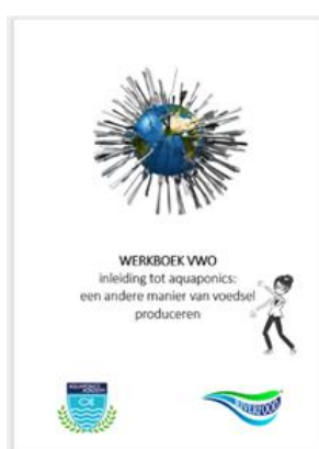
Leerlingwerkboek (digitaal) €60,50 (incl. BTW)