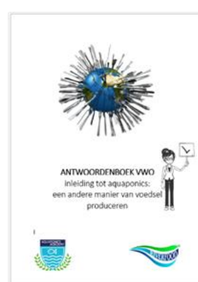
Antwoordenboek (digitaal) €60,50 (incl. BTW)