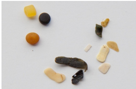
Een ± gemiddelde maaginhoud