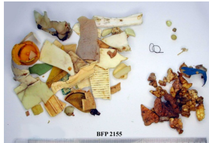
Een extreme maaginhoud