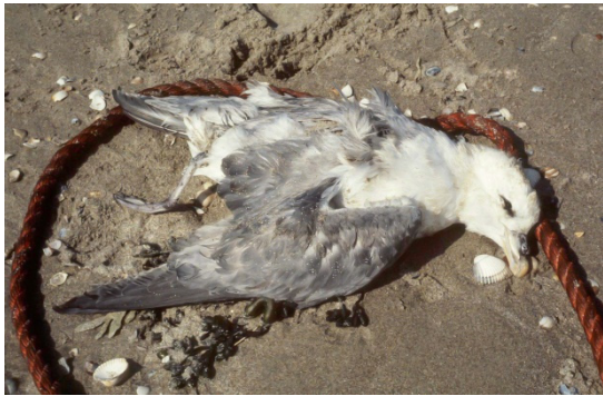
Dode Noordse Stormvogel op strand