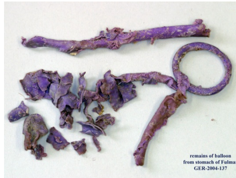
Ballonresten uit maag van stormvogel